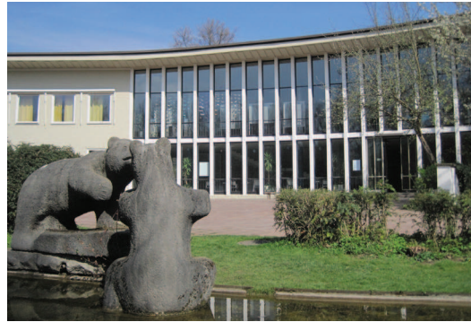
Die Schulen können ein möglicher Förderstandort sein.

Postanschrift Verwaltung: Katholische Jugendfürsorge der Erzdiözese München und Freising e.V. Sozialpädagogische Lernhilfen (SPLH) Lessingstraße 8 80336 München